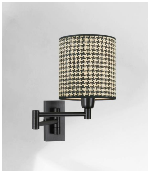
MAMMISI -SW en bronze griffé avec abat-jour en Palmier Pied de Poule (matière de catégorie 5)