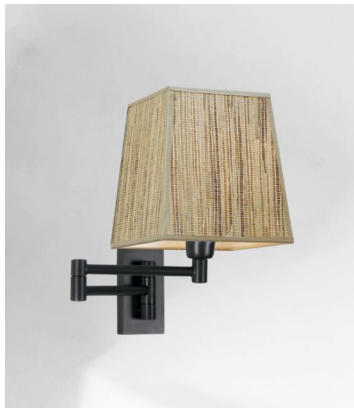
MAMMISI -SW en bronze griffé avec abat-jour en Jacinthe Naturelle (matière de catégorie 5)