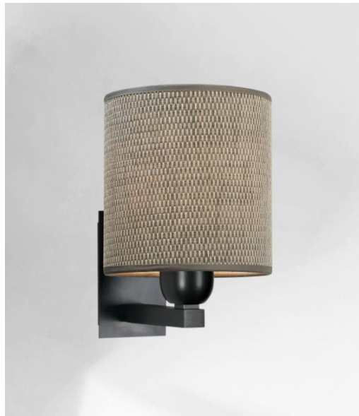
RAMOSE 1 en bronze griffé avec abat-jour en Parma Cendré (tissu de catégorie 4)