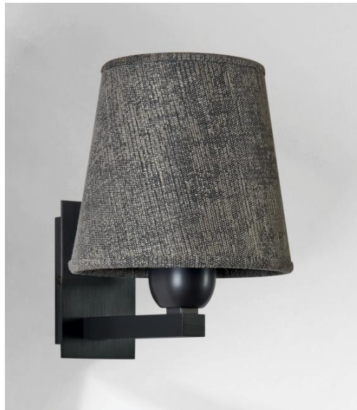
RAMOSE 1 en bronze griffé avec abat-jour en Trento Basalte (tissu de catégorie 3)