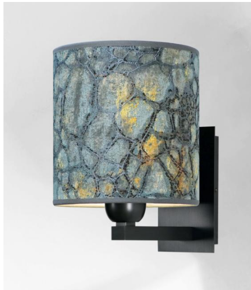
RAMOSE 2 en bronze griffé avec abat-jour en Tilia Starry Blue (tissu de catégorie 5)