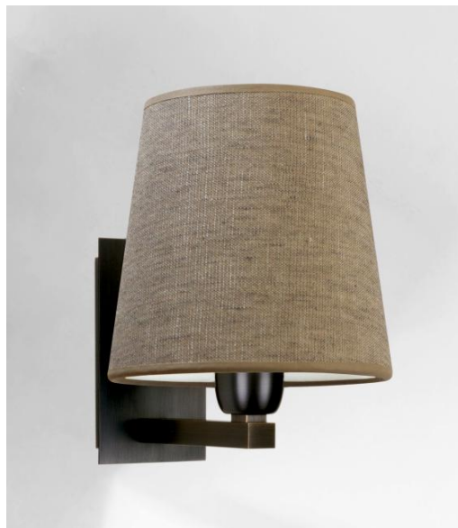
RAMOSE 2 en bronze griffé avec abat-jour en Stone Granit (tissu de catégorie 4)