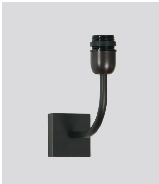
ABA 1 en bronze griffé sans abat-jour