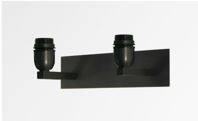
MONTOU en bronze griffé sans abat-jour