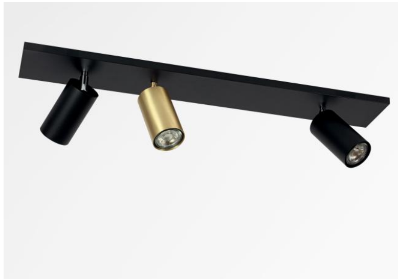
DEIMOS L2+1 en noir structuré et en laiton satiné. Finitions du métal : code 45