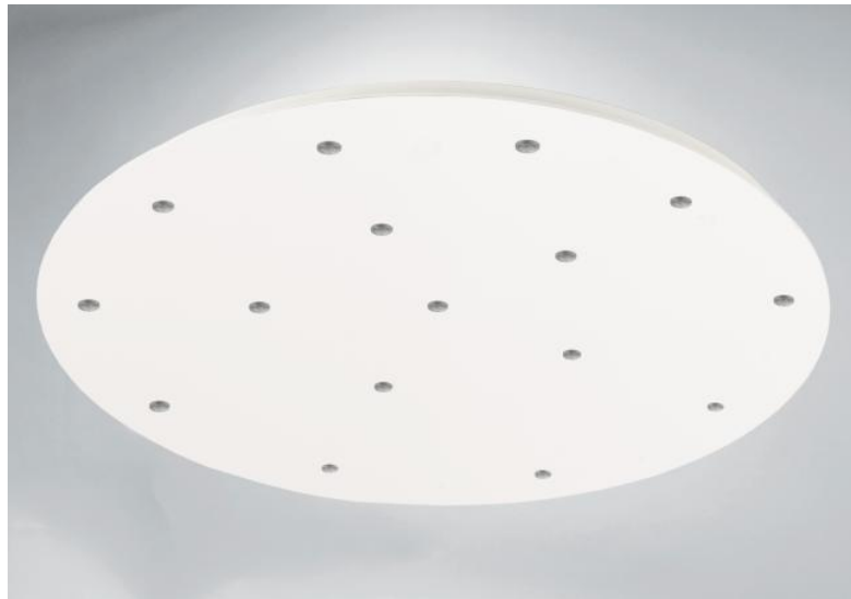
CEILING BASE 16 o83 en blanc structuré. Finition du métal : code 01. En option : un grand choix de câbles et de douilles (+supplément)