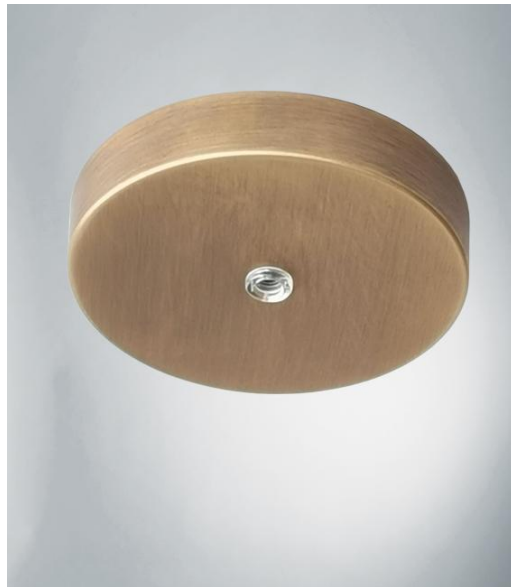
CEILING BASE 1 ø10 en bronze léger (option). Finition du métal : code 28. En option : un grand choix de câbles et de douilles (+ supplément)