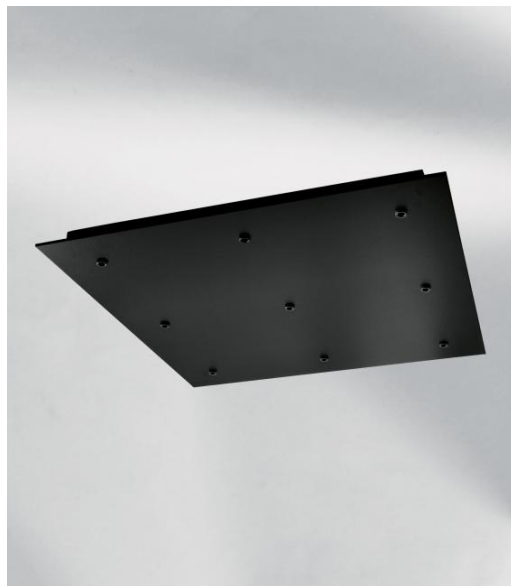
CEILING BASE SQUARE 9 en noir structuré. Finition du métal : code 02. En option : un grand choix de câbles et de douilles (+supplément)