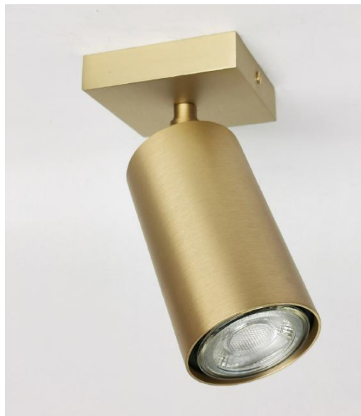
DEIMOS S1 # en laiton satiné. Finition du métal : code 25