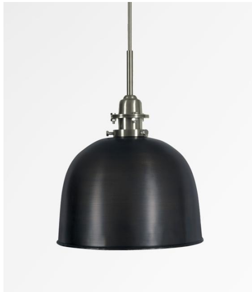
SUPERNOVA en bronze griffé et nickel satiné (code 93)