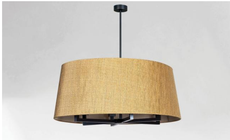
TOURAH 6 OVALE en bronze griffé avec abat-jour ovale de L90cm en Turda Abricot (tissu de catégorie 3)