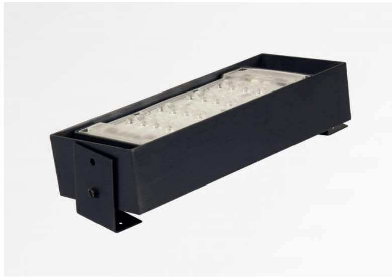
UP 300 en bronze griffé