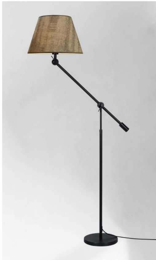
TEMBO en bronze griffé, abat-jour en Wilg Wengé (tissu cat.3)