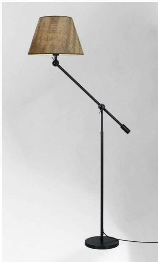
TEMBO en bronze griffé, abat-jour en Wilg Wengé (tissu cat.3)