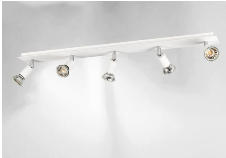
MERCURE 5 en blanc structuré. Finition du métal : code 01