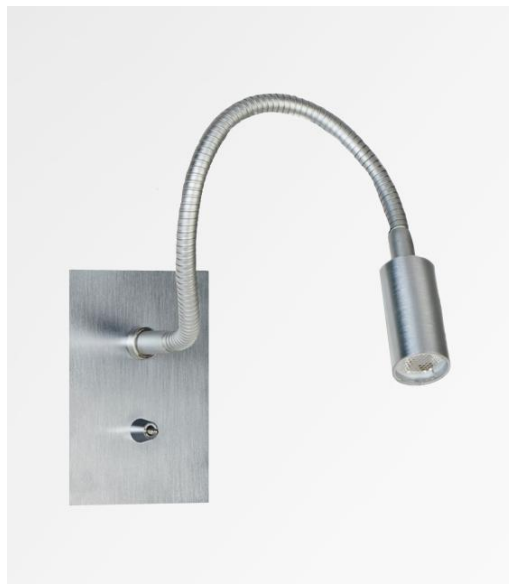
PAROS en chrome satiné. Finition du métal : code 32