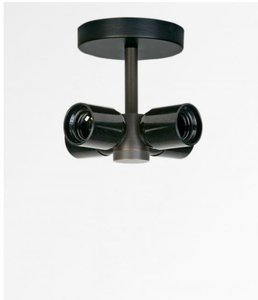
KENTIKA CEILING en bronze griffé