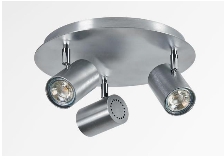
ATLAS 3 en chrome satiné. Finition du métal : code 32