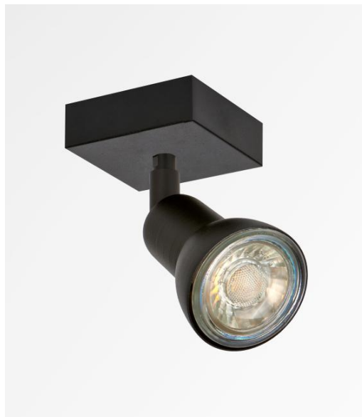
CALLISTO 1 en bronze griffé. Finition du métal : code 29