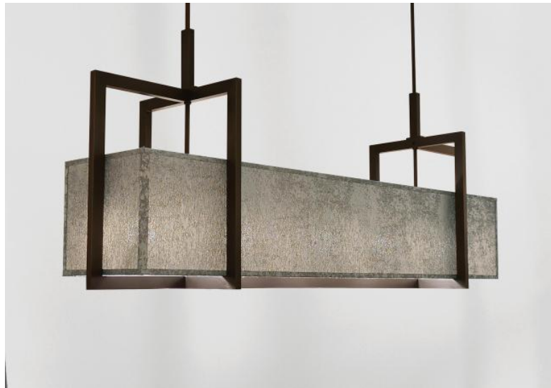
METELIS 155 en bronze griffé avec abat-jour en Gabala Platinum (tissu de catégorie 3)