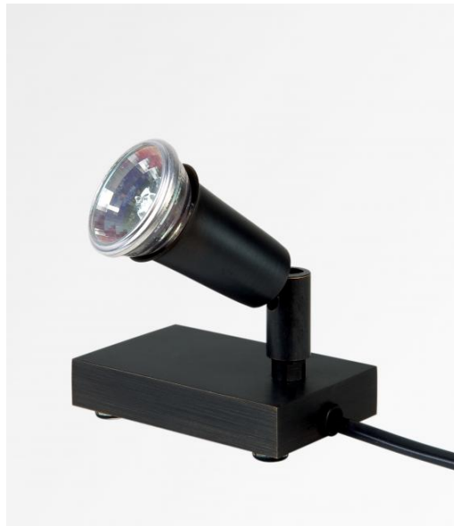
MICRON PL en bronze griffé