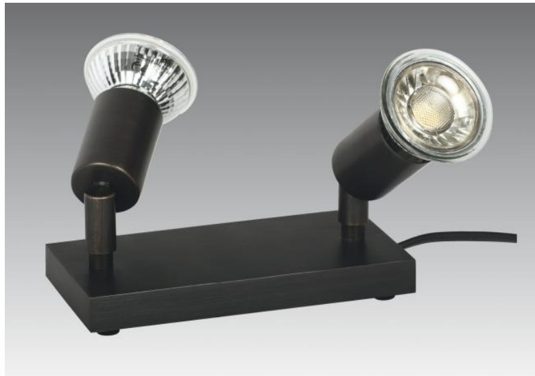
MERCURE PL2 en bronze griffé