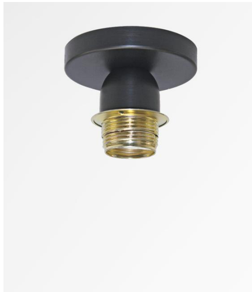
KENTIKA MINI en bronze griffé