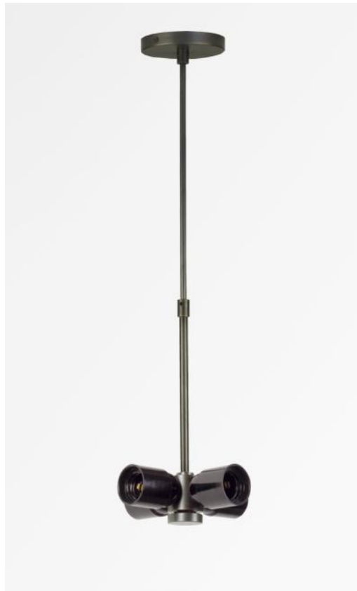
SUSPENSION Ø TUBES NOURRICE en bronze griffé