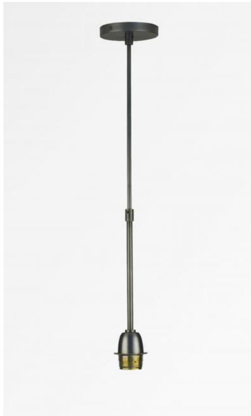
SUSPENSION o TUBES en bronze griffé