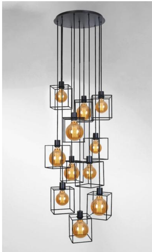
KERMA 11 o38 en bronze griffé avec structures en époxy noir