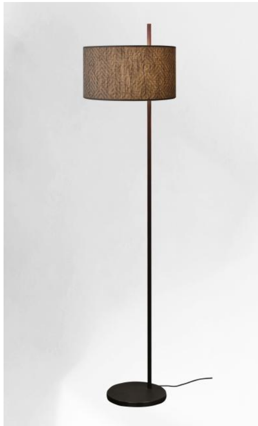
MENDES FLOOR en bronze griffé avec abat-jour en Arrow Casamance (tissu de catégorie 4)