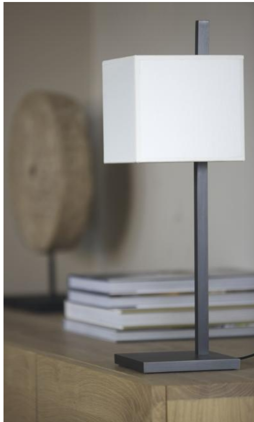
FARAS 1 en bronze griffé avec abat-jour en Coton Calcaire (tissu de catégorie 1)