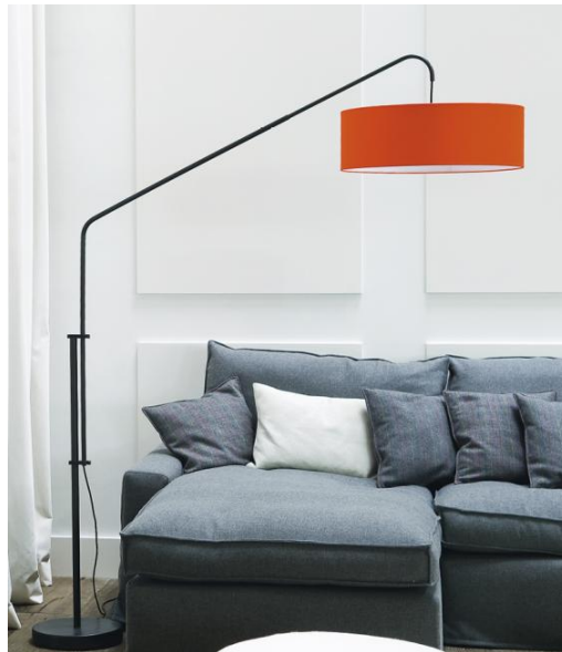
ELEPHANTINE en bronze griffé avec abat-jour en Seta Brique (tissu de catégorie 3)