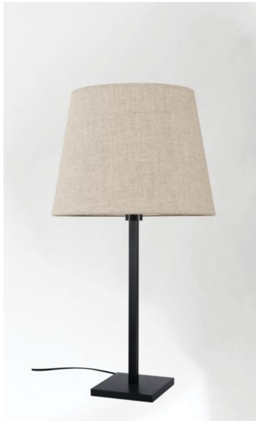
MENNA 3 en bronze griffé avec abat-jour conique en Lin Moscou (tissu de catégorie 2)