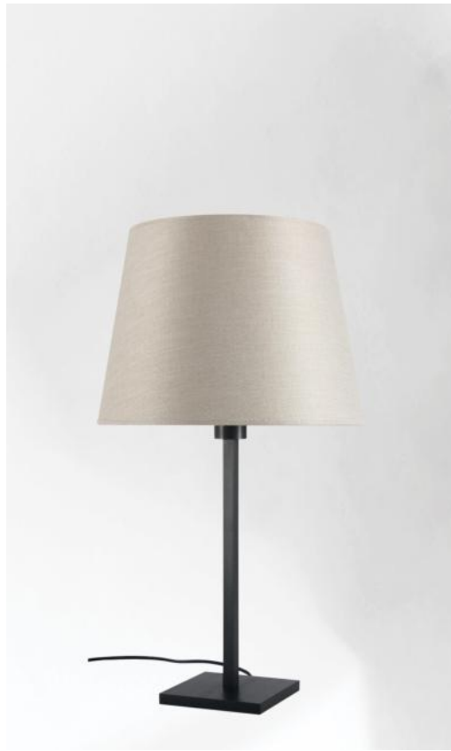
MENNA 2 bronze griffé, abat-jour en Dreams Bambou (tissu catégorie 2)