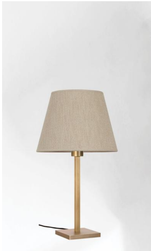
MENNA 1 en bronze léger avec abat-jour conique en Parma Merisier (tissu de catégorie 4)