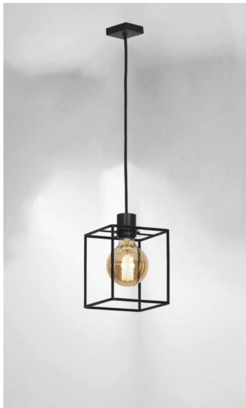
KERMA SQUARE 1 en bronze griffé avec structure en époxy noir