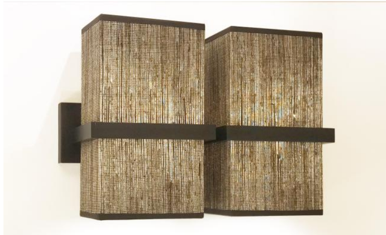
TETI 2 en bronze griffé avec deux abat-jour rectangulaires en Jacinthe Miel Noir (matière de catégorie 5)