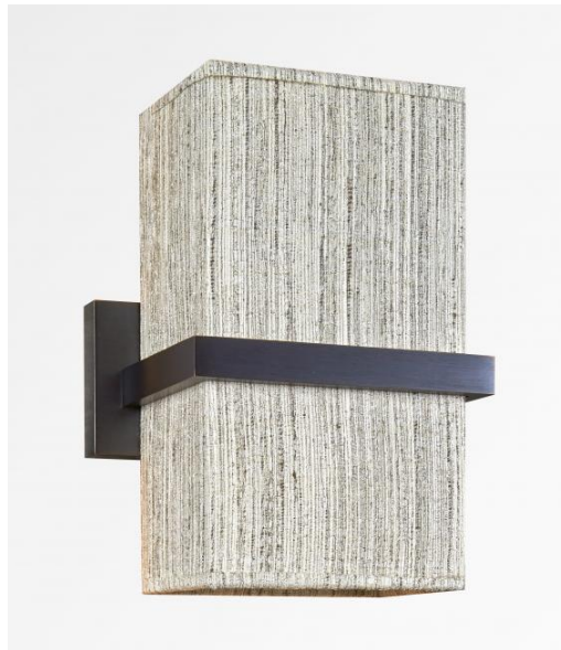
TETI 1 en bronze griffé avec abat-jour en Turda blond (tissu catégorie 3)