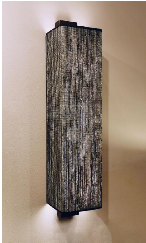
CHABAKA 2 # en bronze griffé avec abat-jour en Jacinthe Miel Noir (matière de catégorie 5)