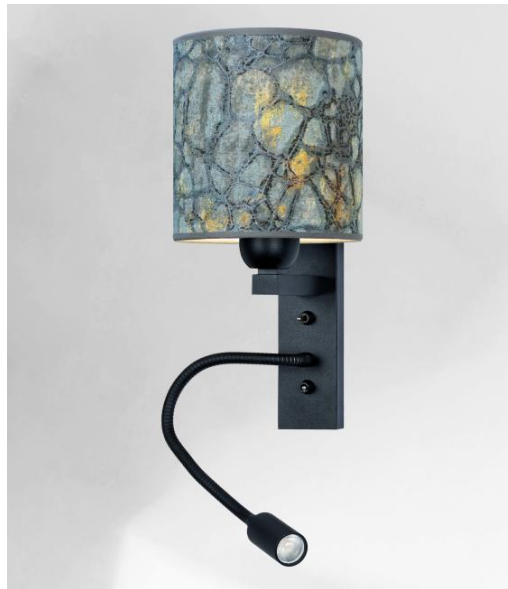
KARY en noir structuré avec abat-jour en Tilia Starry Blue (tissu cat.4)