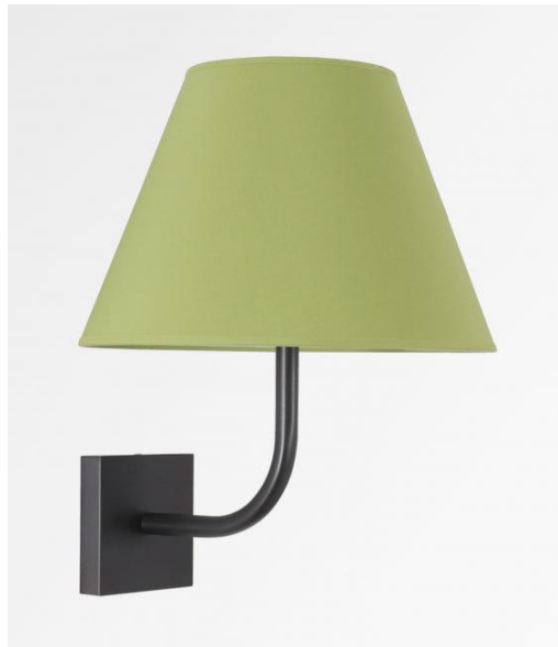
ABA 2 en bronze griffé avec abat-jour en Coton vert prairie (tissu de catégorie 1)