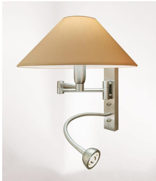
AHMES en nickel satiné avec abat-jour en Coton Sahara (tissu de catégorie 1)