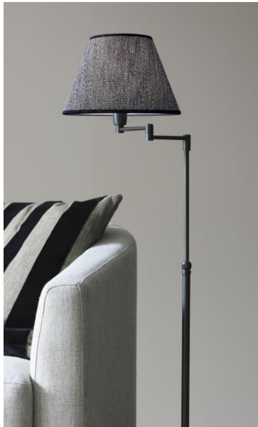
KEKOU en bronze griffé, abat-jour en Parma Régliste (tissu catégorie 4)