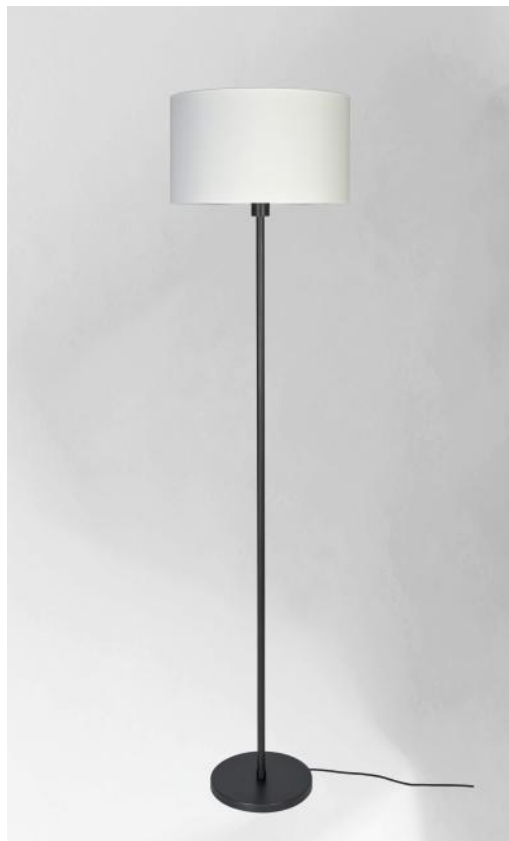
IMAT en bronze griffé avec abat-jour en Coton Calcaire (tissu de catégorie 1)