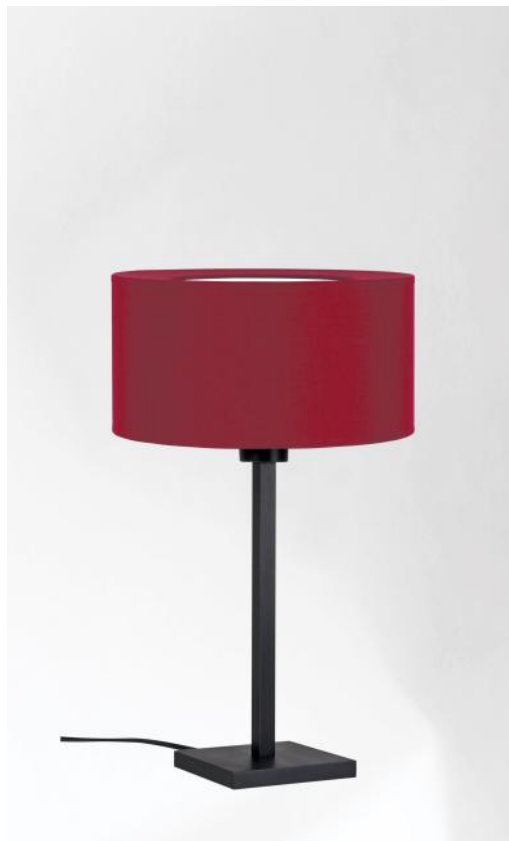
MENNA 1 en bronze griffé avec abat-jour en Seta Framboise (tissu de catégorie 3)