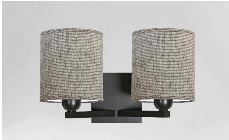
SECHAT en bronze griffé avec abat-jour en Esmaria Avoine (tissu de catégorie 3)