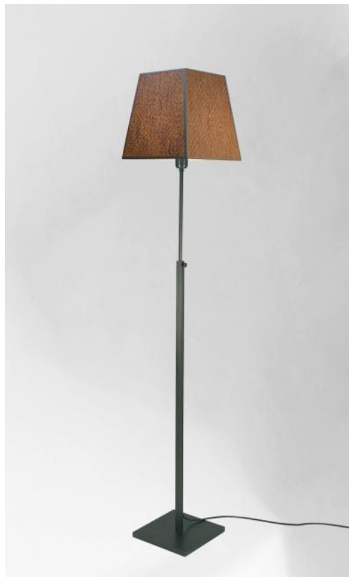
ZABARAH en bronze griffé avec abat-jour en Arrow Casamance (tissu de catégorie 4)