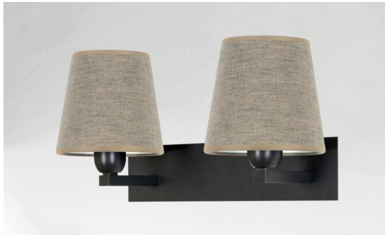
MONTOU en bronze griffé avec abat-jour en Stone Granit (tissu de catégorie 4)