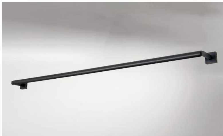
CREMONE 125 en bronze griffé. Finition du métal : code 29