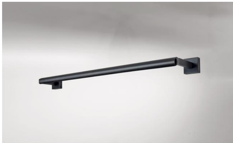
CREMONE 65 en bronze griffé. Finition du métal : code 29